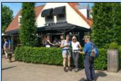
Derde Dauwtraptocht zit erop. Wordt het een traditie?