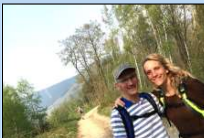
Verslag clubreis 21 april: samen genieten in de Ardennen